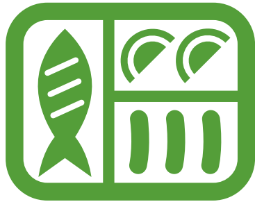
Mad og drikke

Personale og forældreråd har i samarbejdet følgende holdning til dit barns medbragte frokost og eftermiddagsmad :