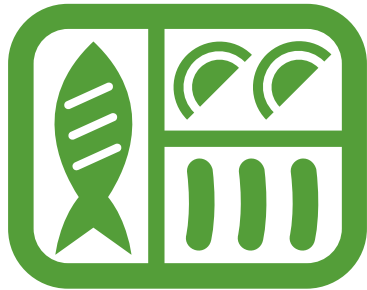
Mad og drikke

Personale og forældreråd har i samarbejdet følgende holdning til dit barns medbragte frokost og eftermiddagsmad :